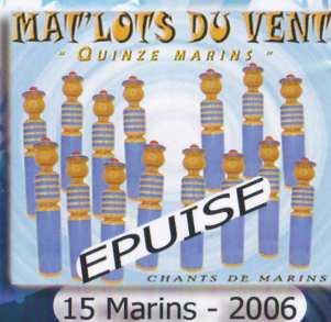
15 Marins - 2006