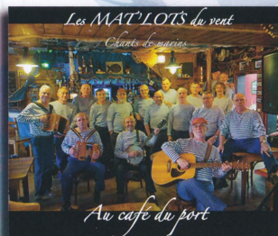
Au café du port - 2012